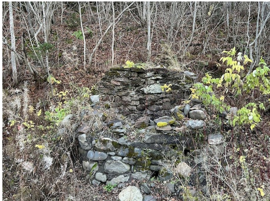
Le four révèle des indices sur les premières activités économiques de Rimouski.

Cette démarche vise à découvrir d'éventuels artefacts qui permettraient de mieux comprendre l'histoire de ce four et son rôle dans les premières activités économiques