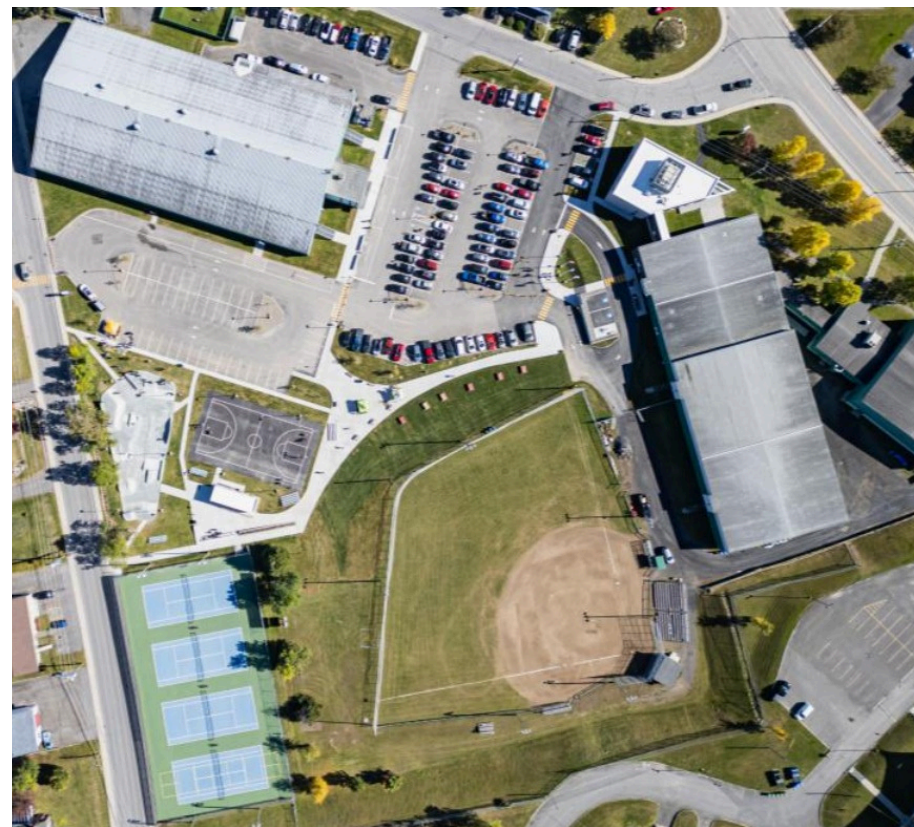
Le projet figure parmi les plus importants de l'histoire d'Amqui.

Les villes finalistes au Mérite Ovation municipale 2026 présenteront leurs réalisations les 14 et 15 mai, dans le cadre des assises annuelles de l'UMQ au Centre des congrès de Québec. Les lauréats seront dévoilés lors du gala, prévu le 15 mai.