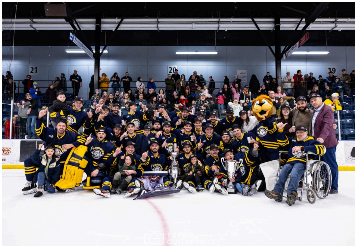
Les Castors sont les nouveaux champions de la Ligue de hockey senior de l'Est-du-Québec.