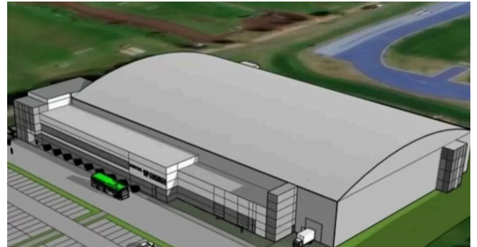
Une esquisse du futur stade multisports de Rimouski.

Les grandes lignes des critères à évaluer par le comité de sélection sont la vision architecturale du projet (5 %), la fonctionnalité du bâtiment et de ses aménagements (10 %), l'harmonisation avec le secteur d'implantation (5 %), la compréhension et la méthodologie du mandat (15 %), l'échéancier et le contrôle de qualité et des coûts (15 %), le dépassement des exigences techniques demandées (15 %),