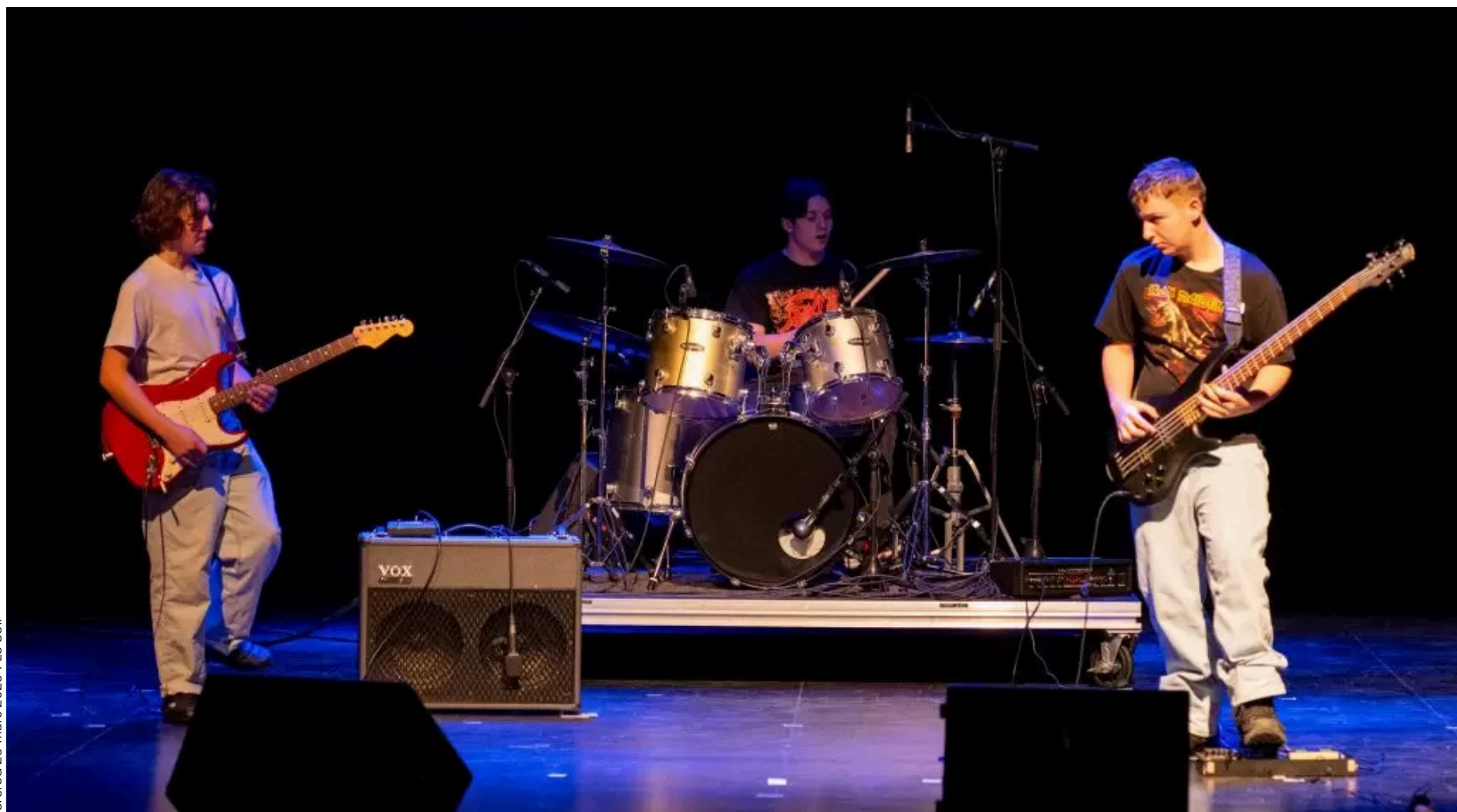
Des élèves offrent une prestation lors d'une finale de Secondaire en spectacles.

Billets en vente pour chacune des finales, au coût de 10 $, auprès des écoles participantes et à l'entrée, le soir des spectacles.